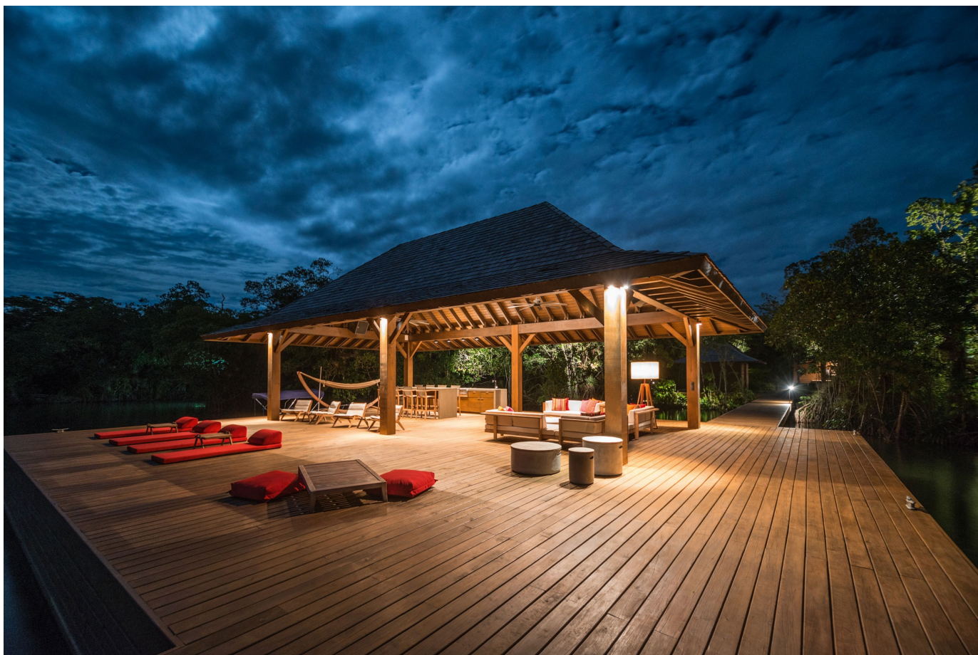
Imagen del proyecto